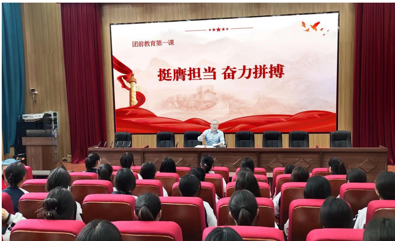
图 18：2024 年 9 月 13 日，我校党总支书记讲授“挺膺担当 奋力拼搏”团前教育第一课