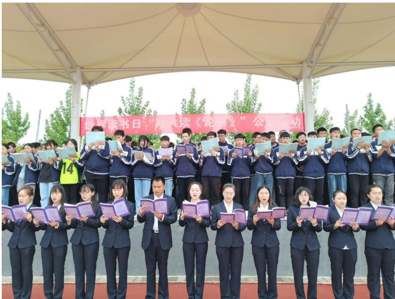
图 25： 我校组织万人读论语活动