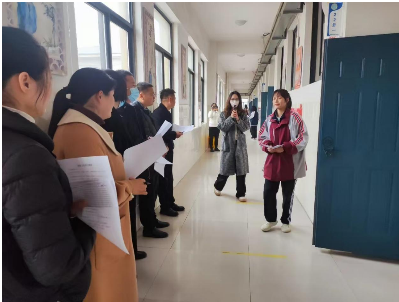
图 10：学校各科室协同进行班级文化评比