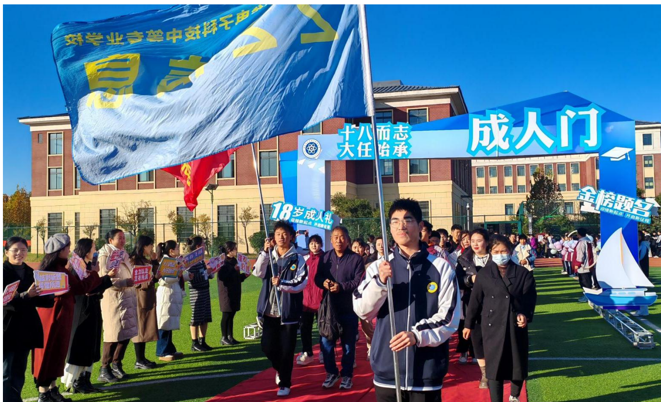
图 21：2024 年 11 月 29 日，我校开展“十八而至 大任始承”十八岁成人礼活动