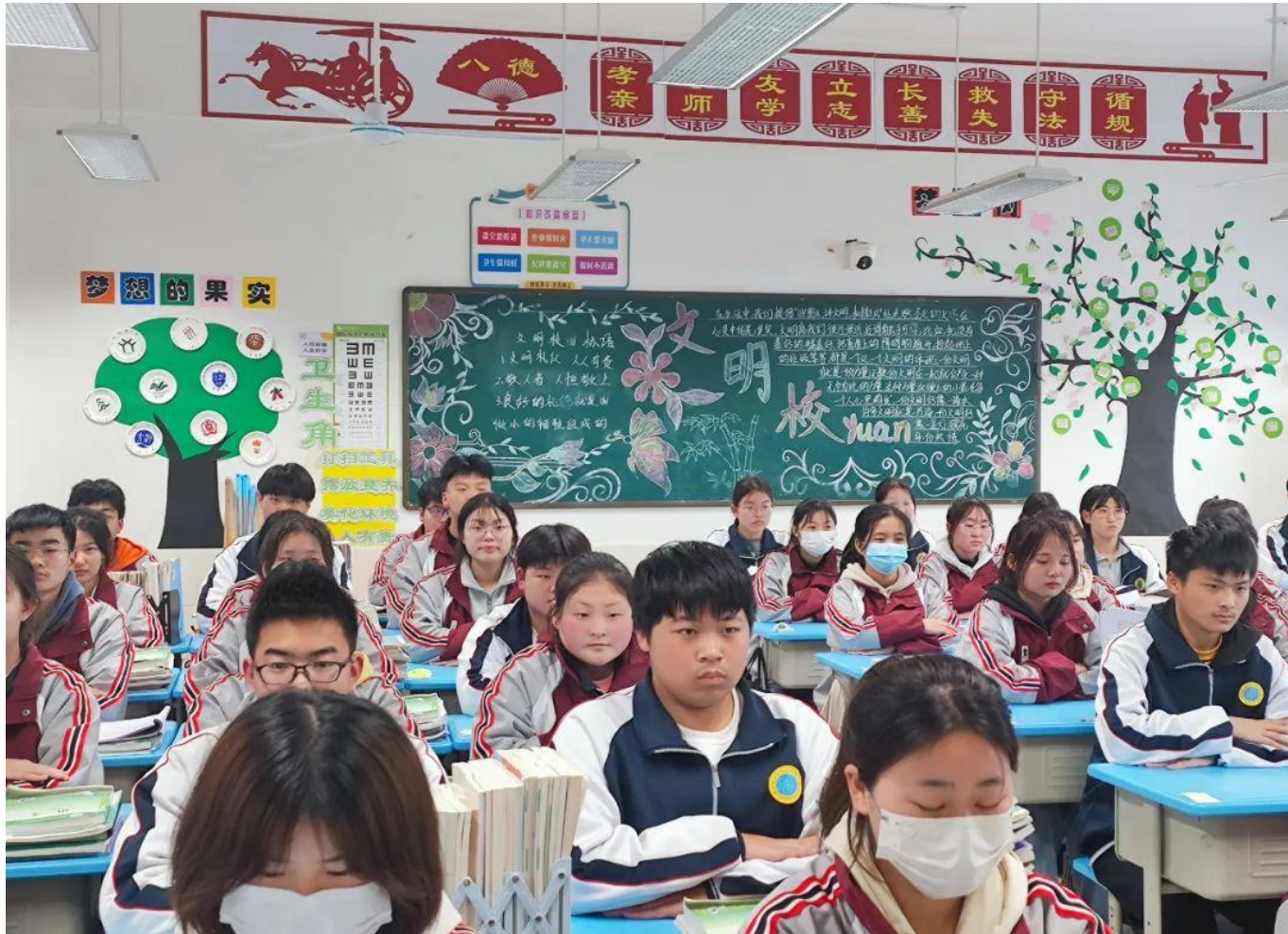
图 9：学校组织班级文化展示