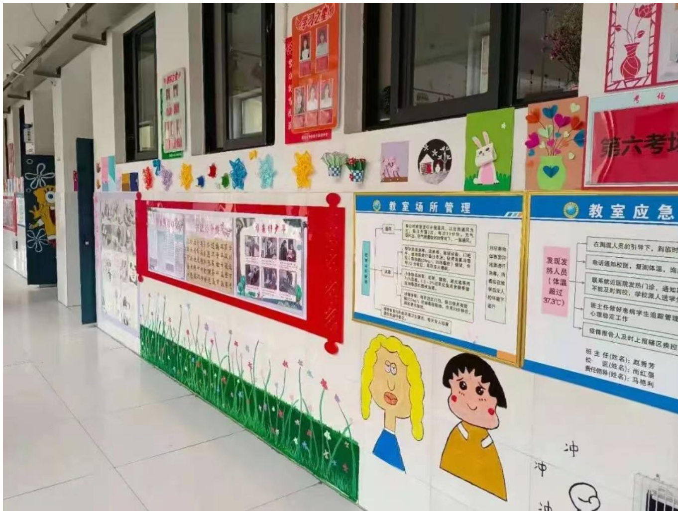
图 26：我校开展班级文化建设活动