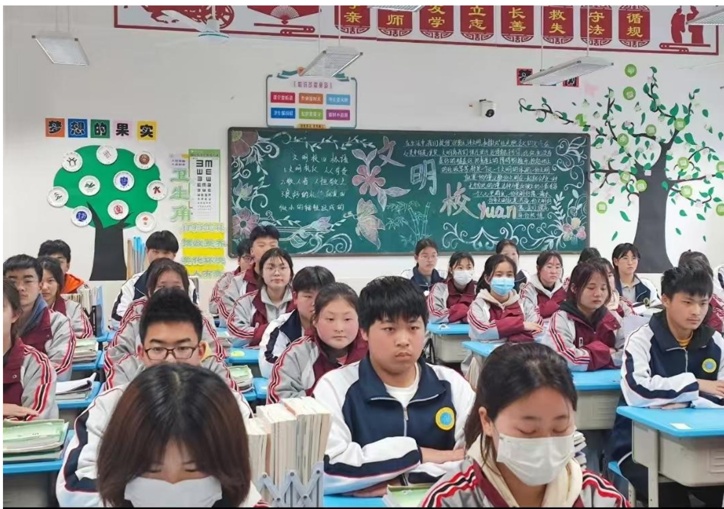
图 5：德育教育文化墙