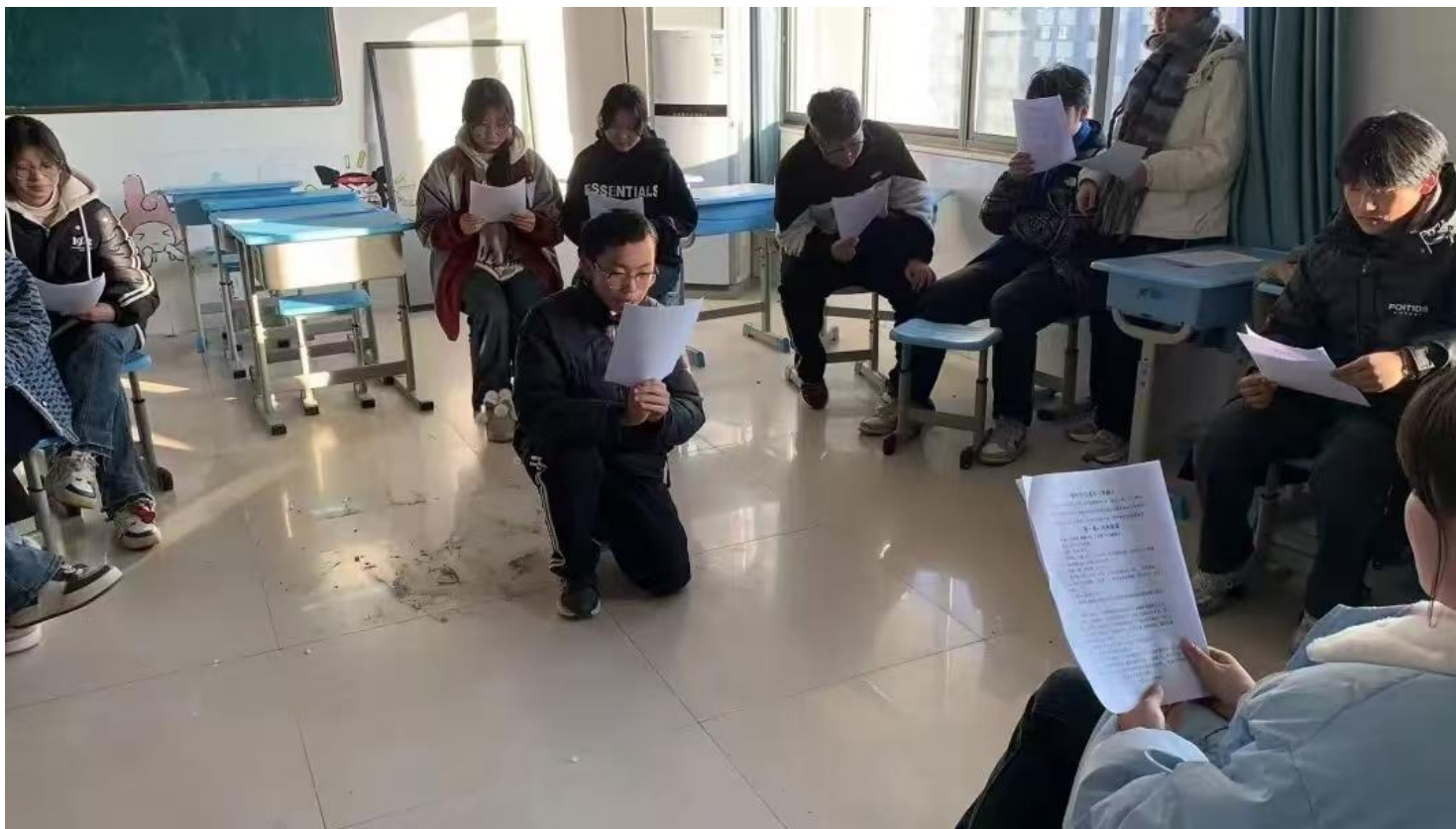
图 11：丰富多彩的社团活动