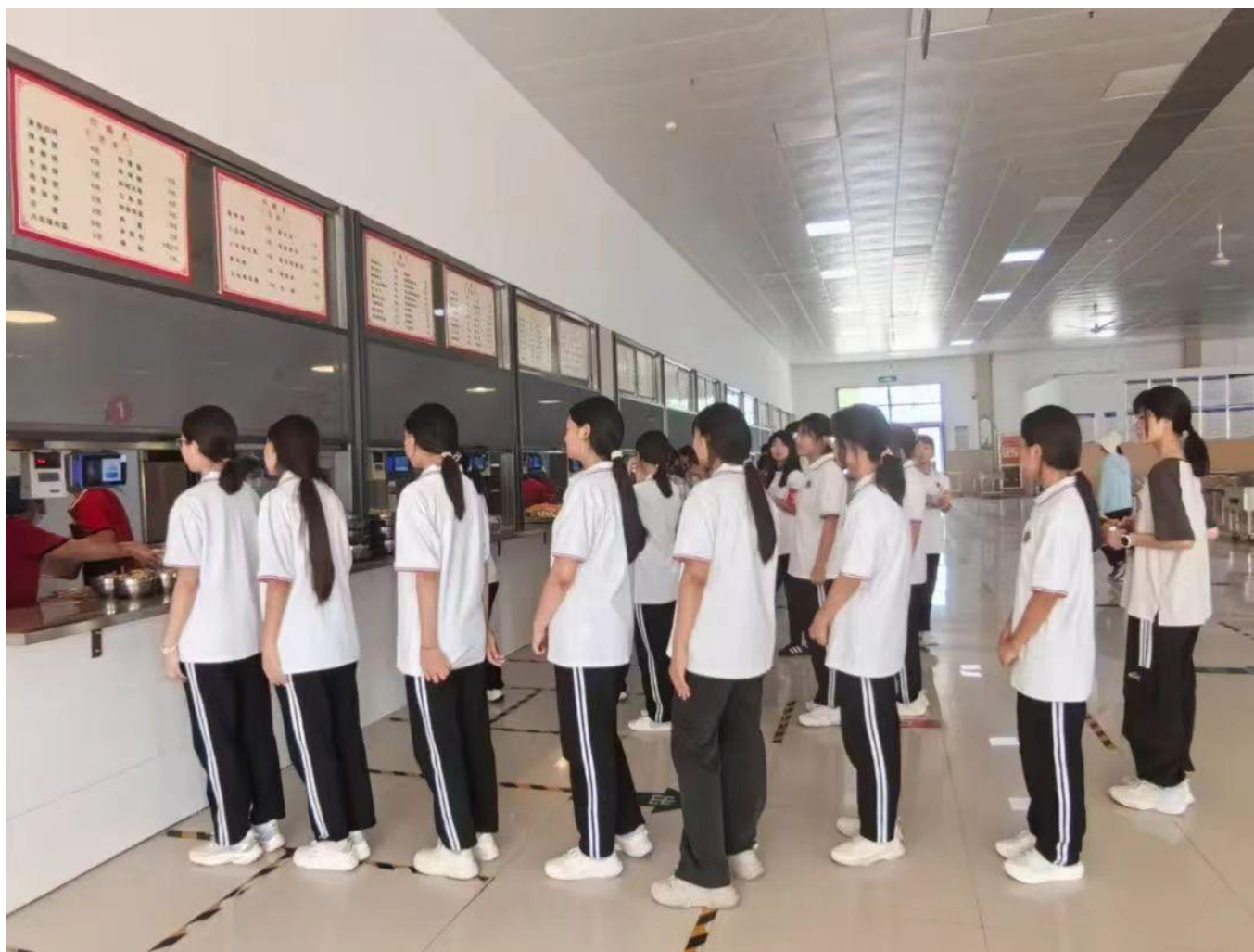
图 28：我校组织无声就餐活动