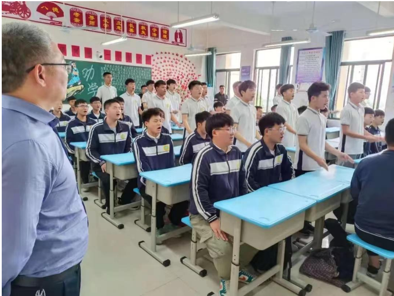
图 27：我校组织丰富的班级文化活动