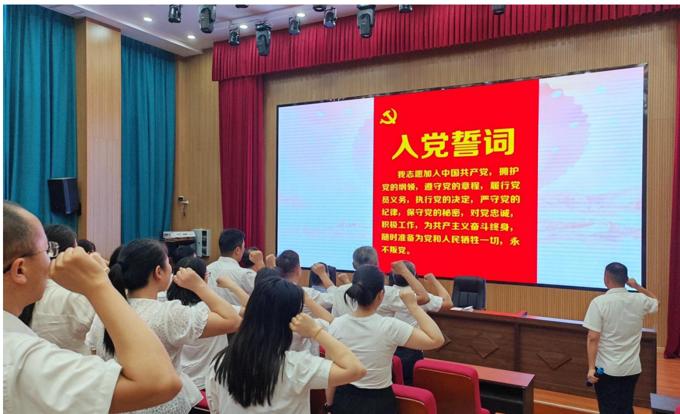
图 17：2024 年 6 月 14 日，我校开展“党纪学习教育”总支书记讲党课