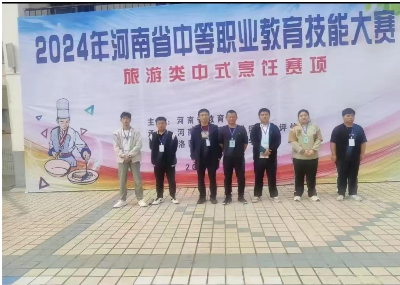
图 12:2024 年河南省中职技能竞赛一等奖