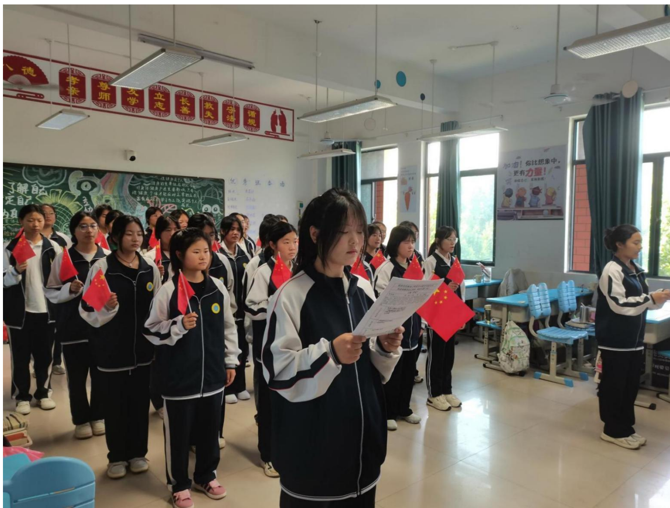
图 34： 我校开展弘扬传统文化活动