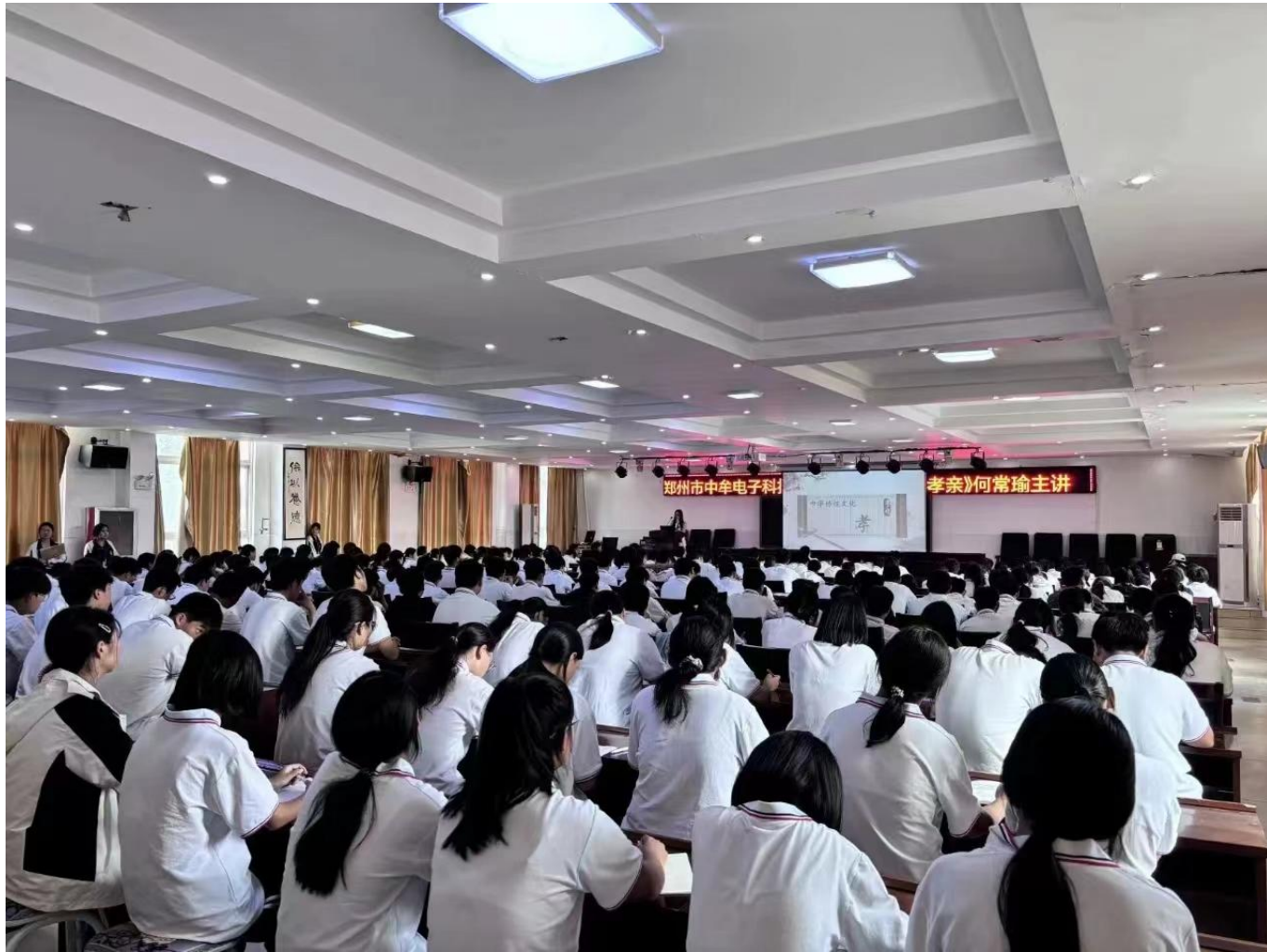
图 31：学生学习孝亲文化