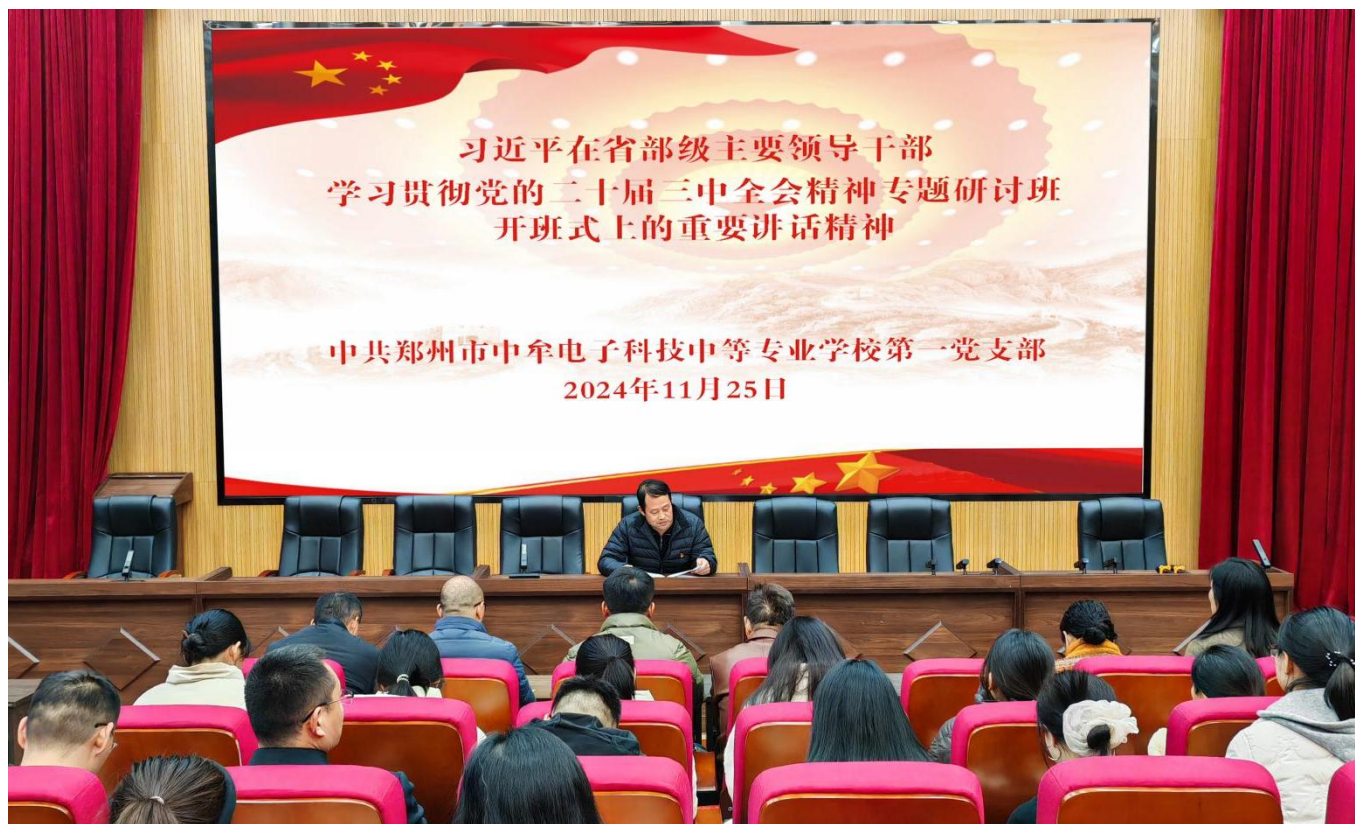
图 20：2024 年 11 月 25 日，我校开展“学习贯彻党的二十届三中全会精神培训”集中学习