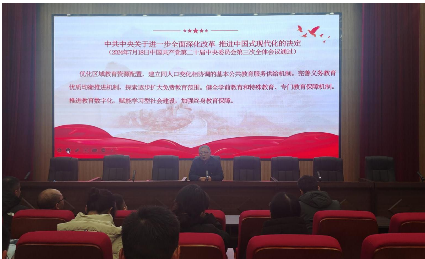
图 22: 2024 年 12 月 6 日, 我校开展集中学习“中共中央关于进一步全面深化改革 推进中国式现代化的决定”