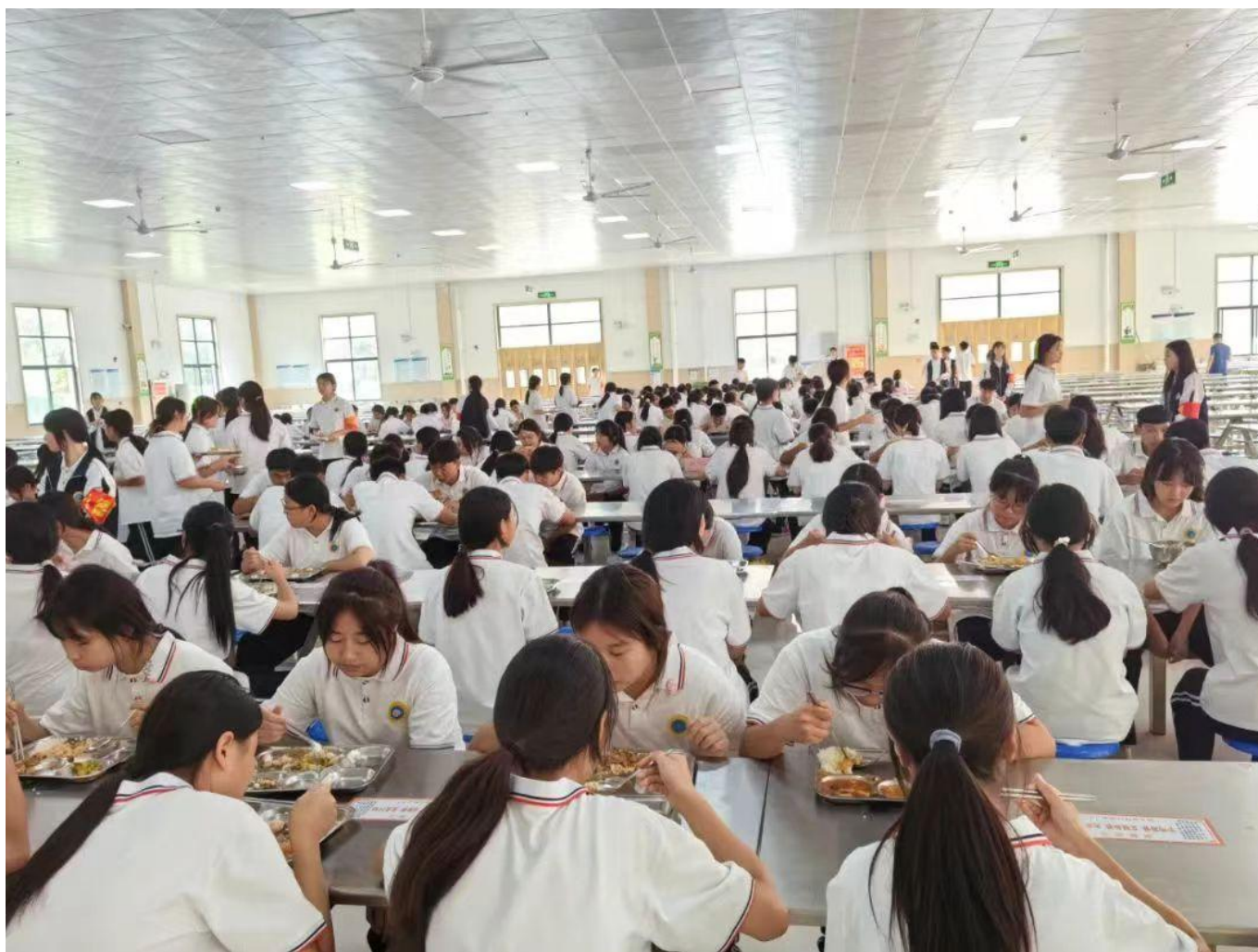
图 29：我校学生开展无声就餐及光盘行动