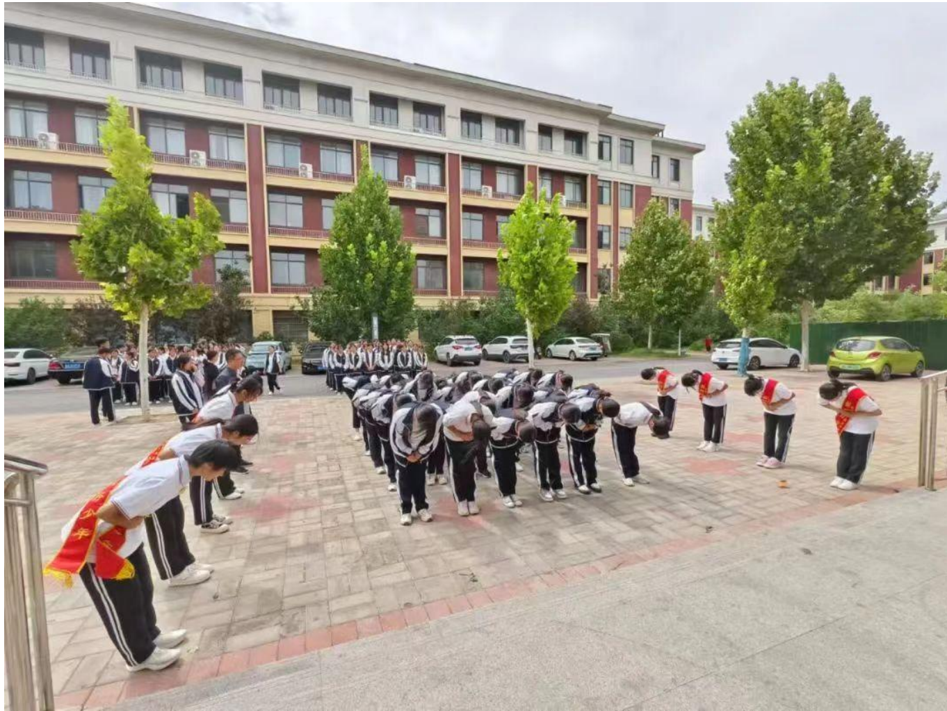
图 30：学生学习就餐礼仪