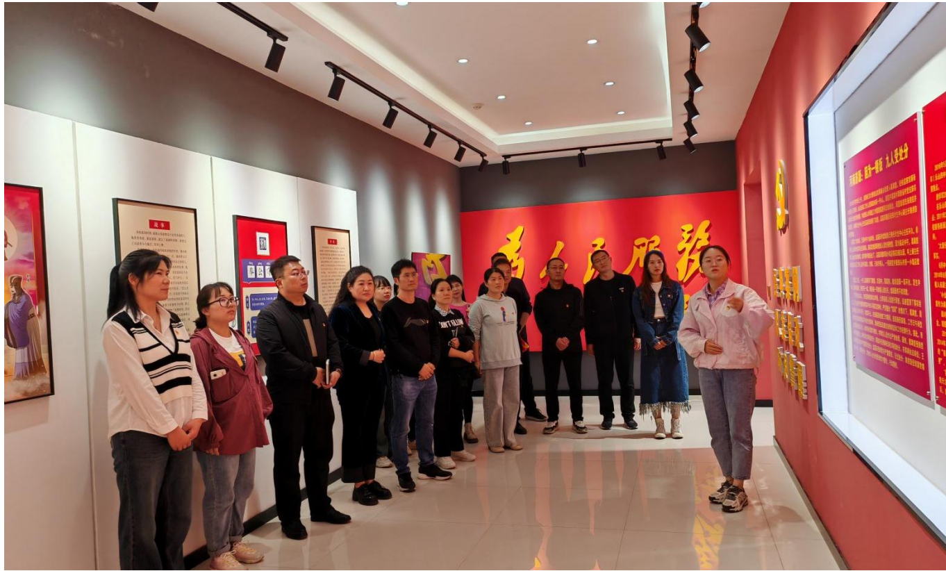
图 19：2024 年 10 月 16 日，组织我校青年教师参观党风廉政教育基地