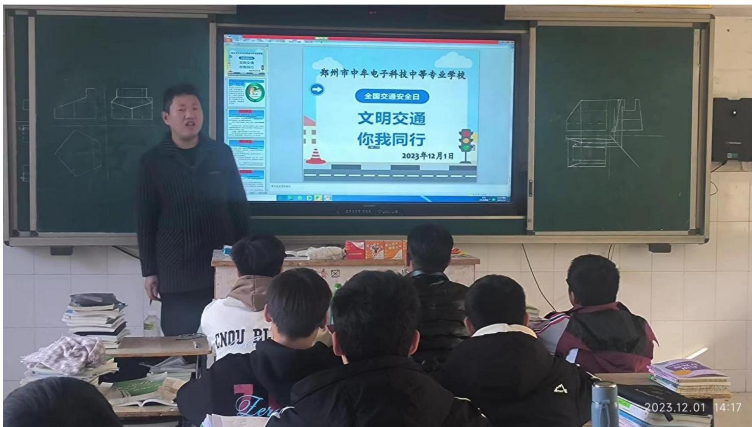
图 2：交通安全教育主题班会