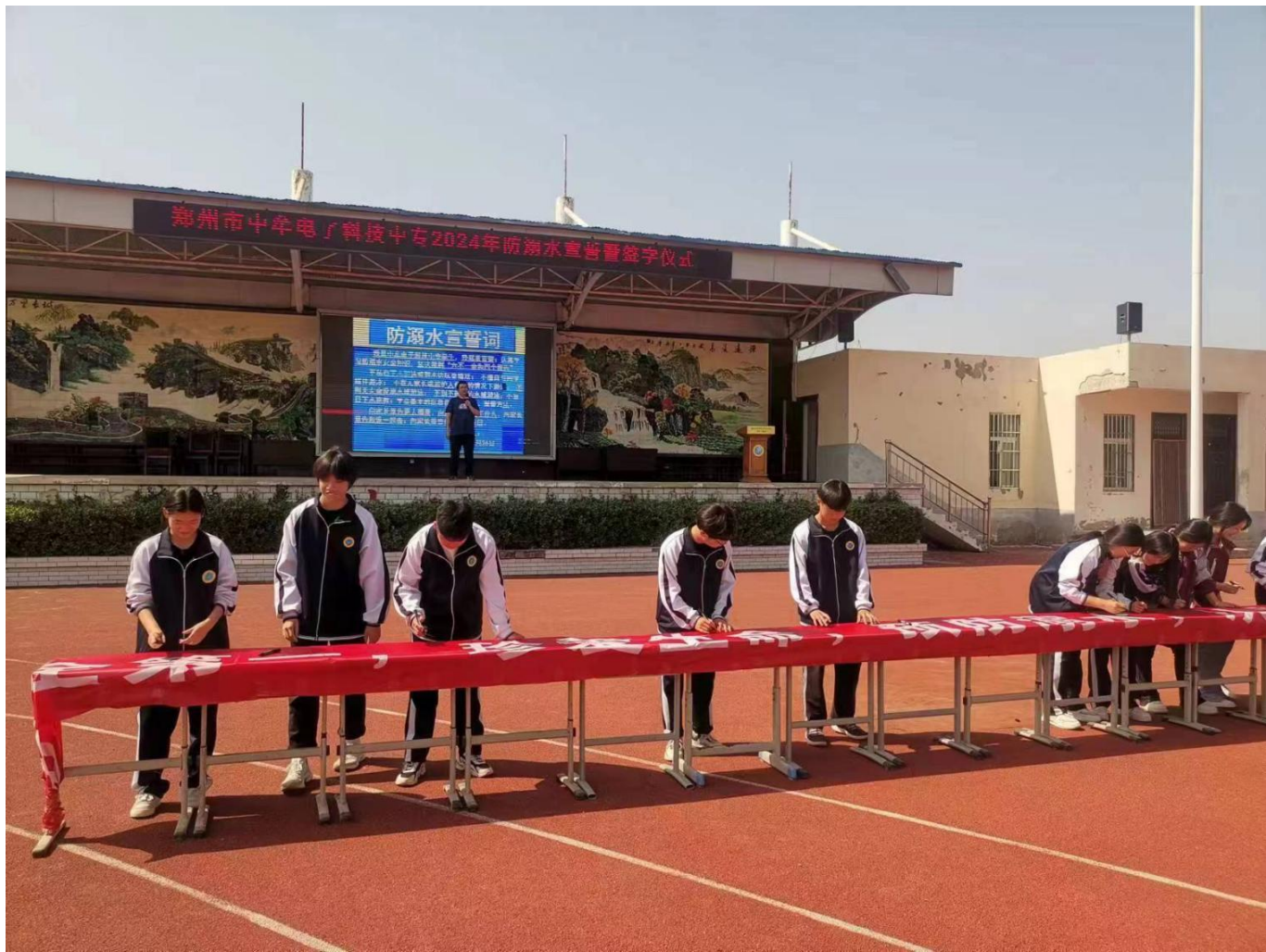
图 3：防溺水宣誓暨签字活动