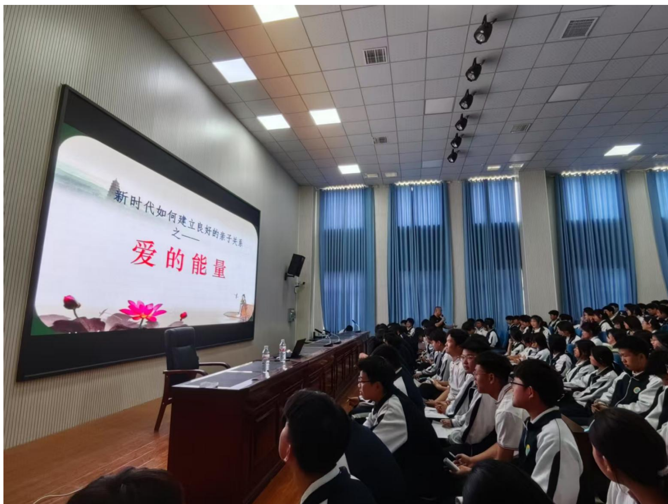
图 32：学生学习《爱的能量》