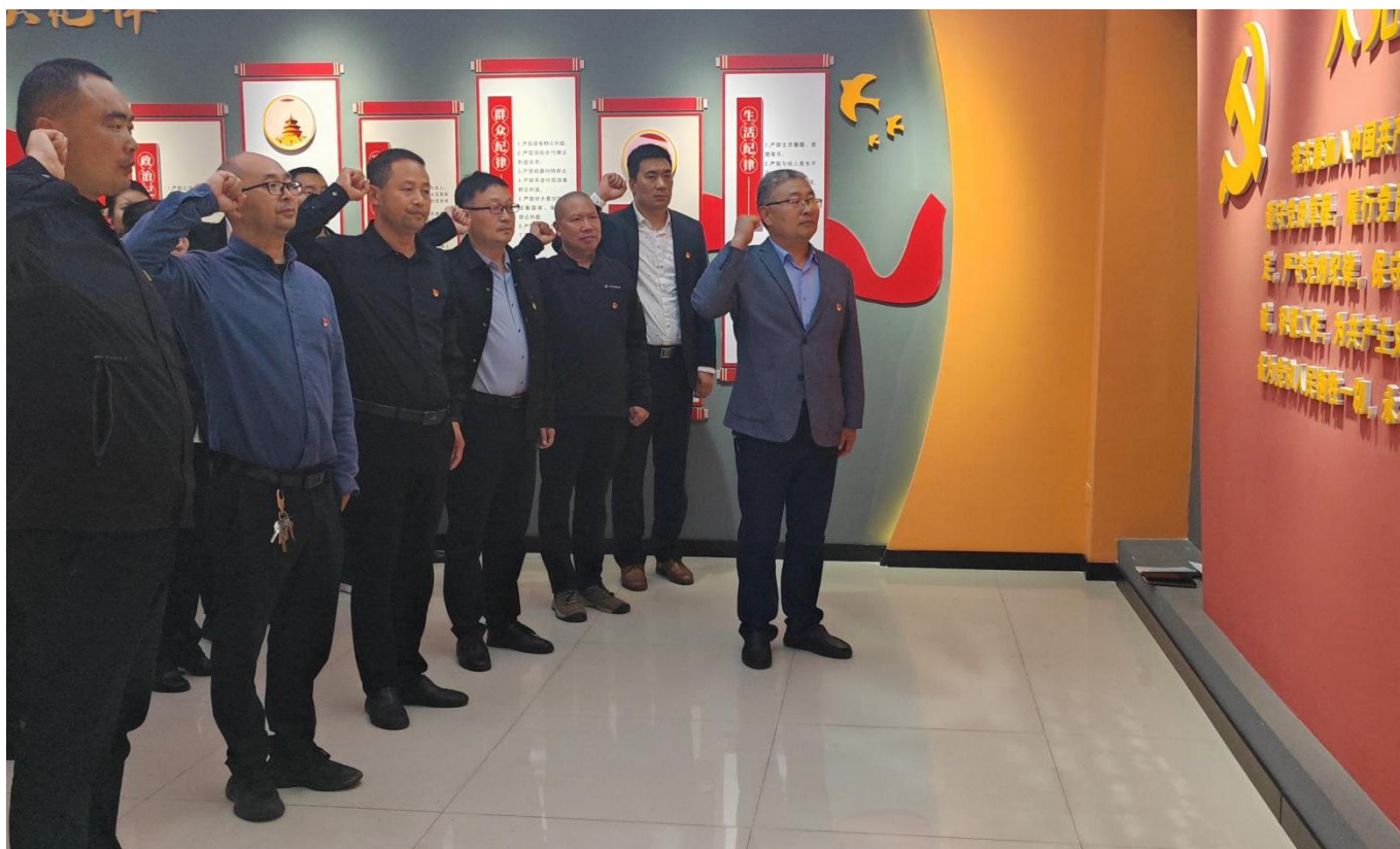
图 19：2025 年 4 月 25 日，我校全体党员参观廉政教育基地