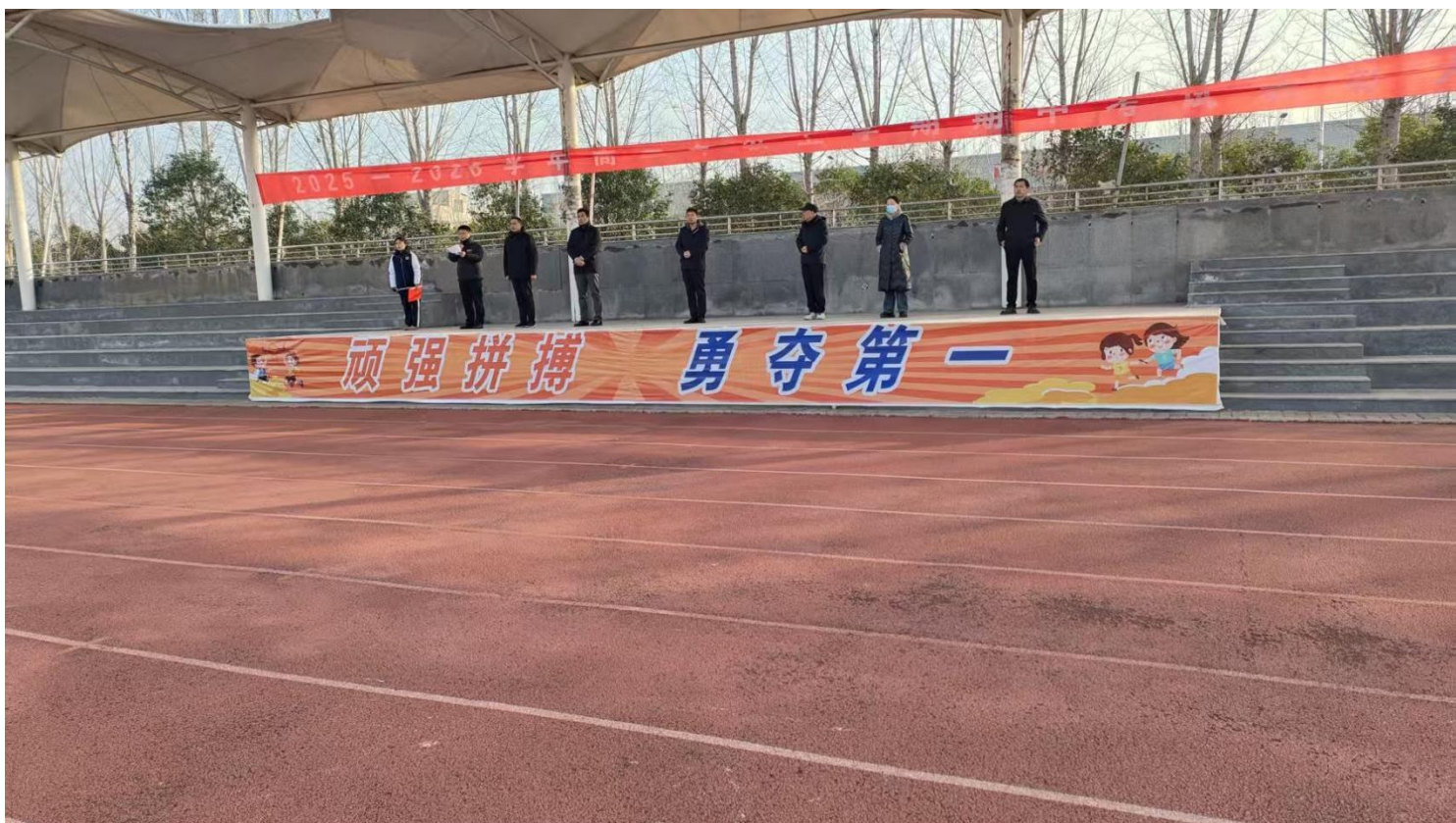
图 5：防欺凌安全教育