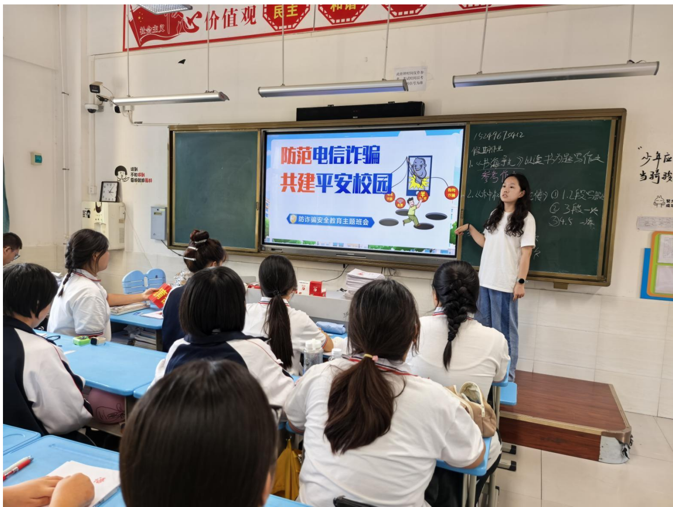
图 3：反诈骗安全教育主题班会