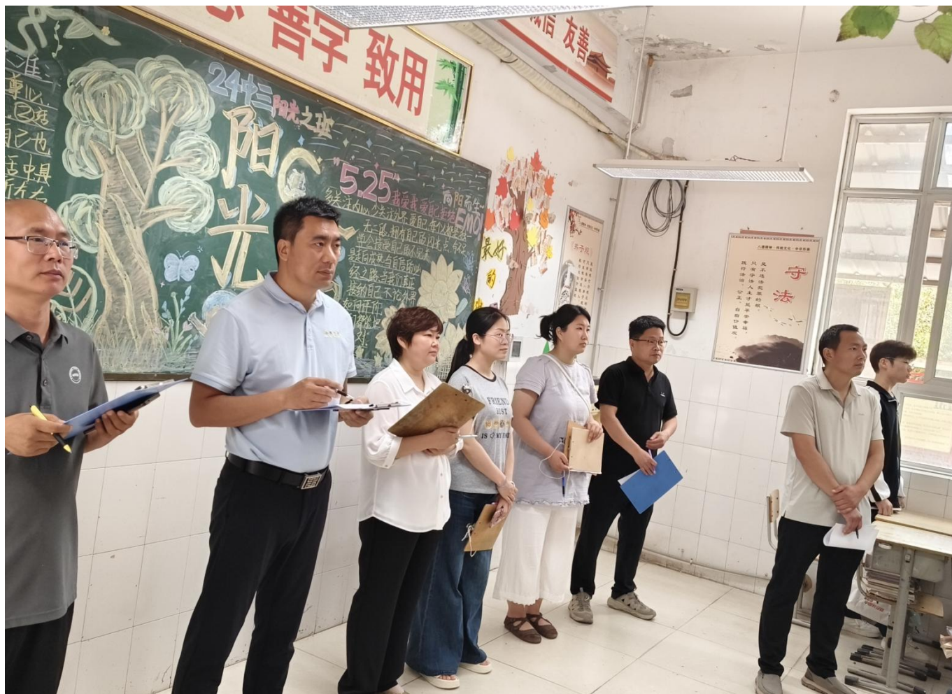
图 10：学校各科室协同进行班级文化评比