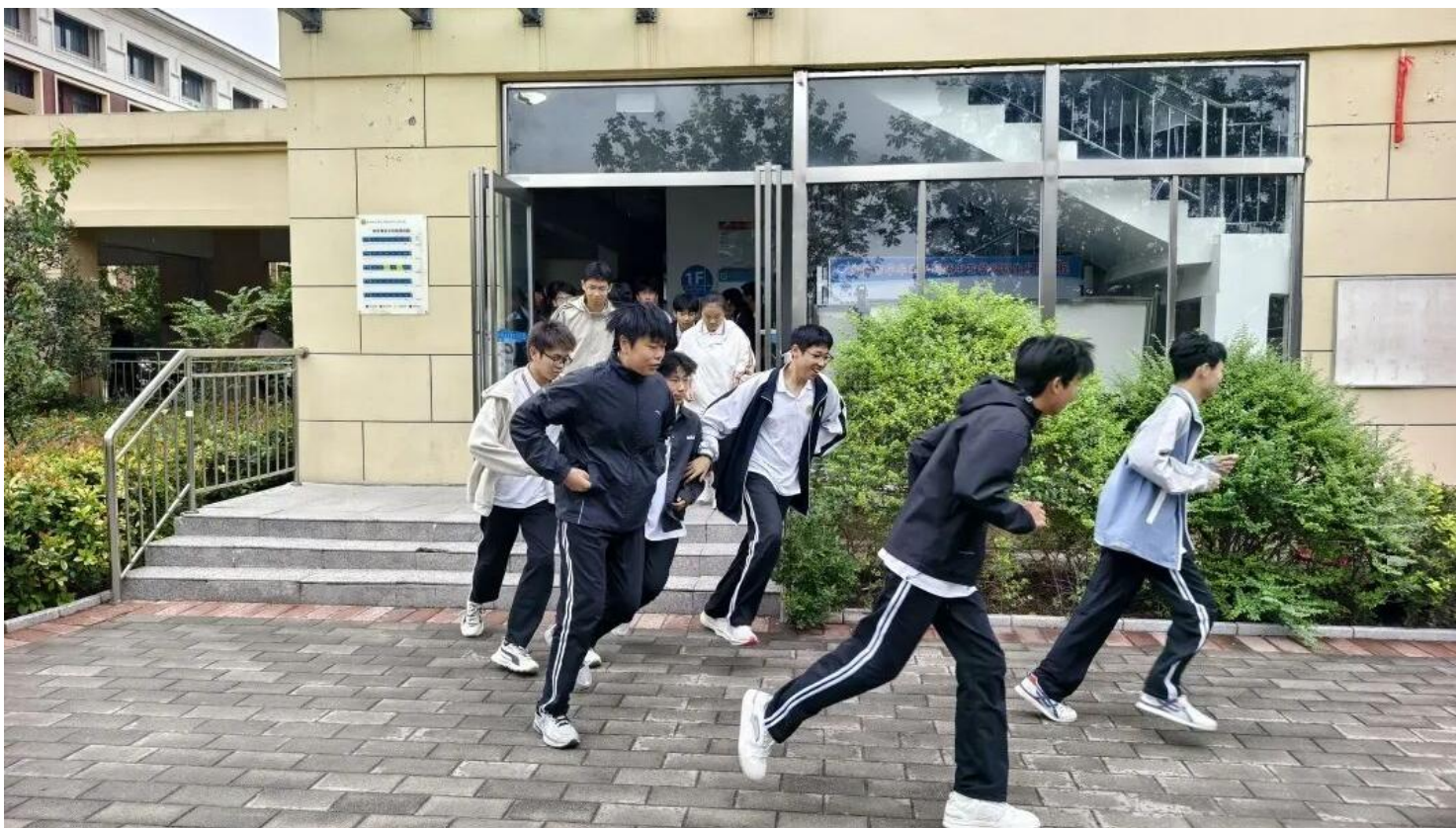
图 4：安全紧急疏散演练活动