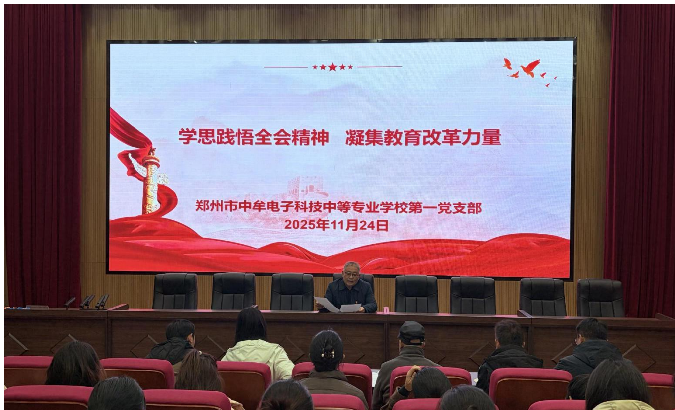
图 22：2025 年 11 月 24 日，我校开展“学习贯彻党的二十届四中全会精神”专题会议