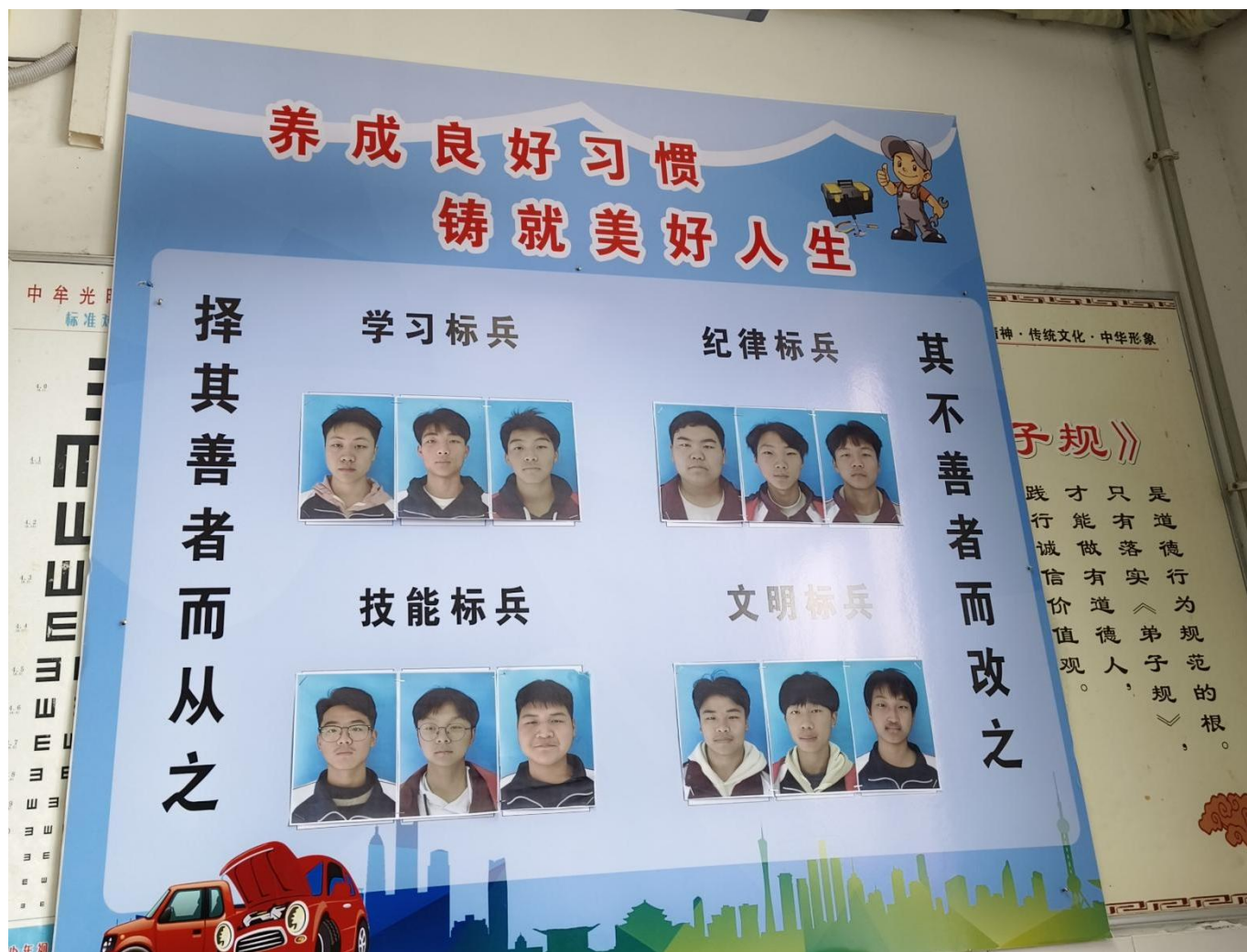
图 9：学校组织班级文化展示