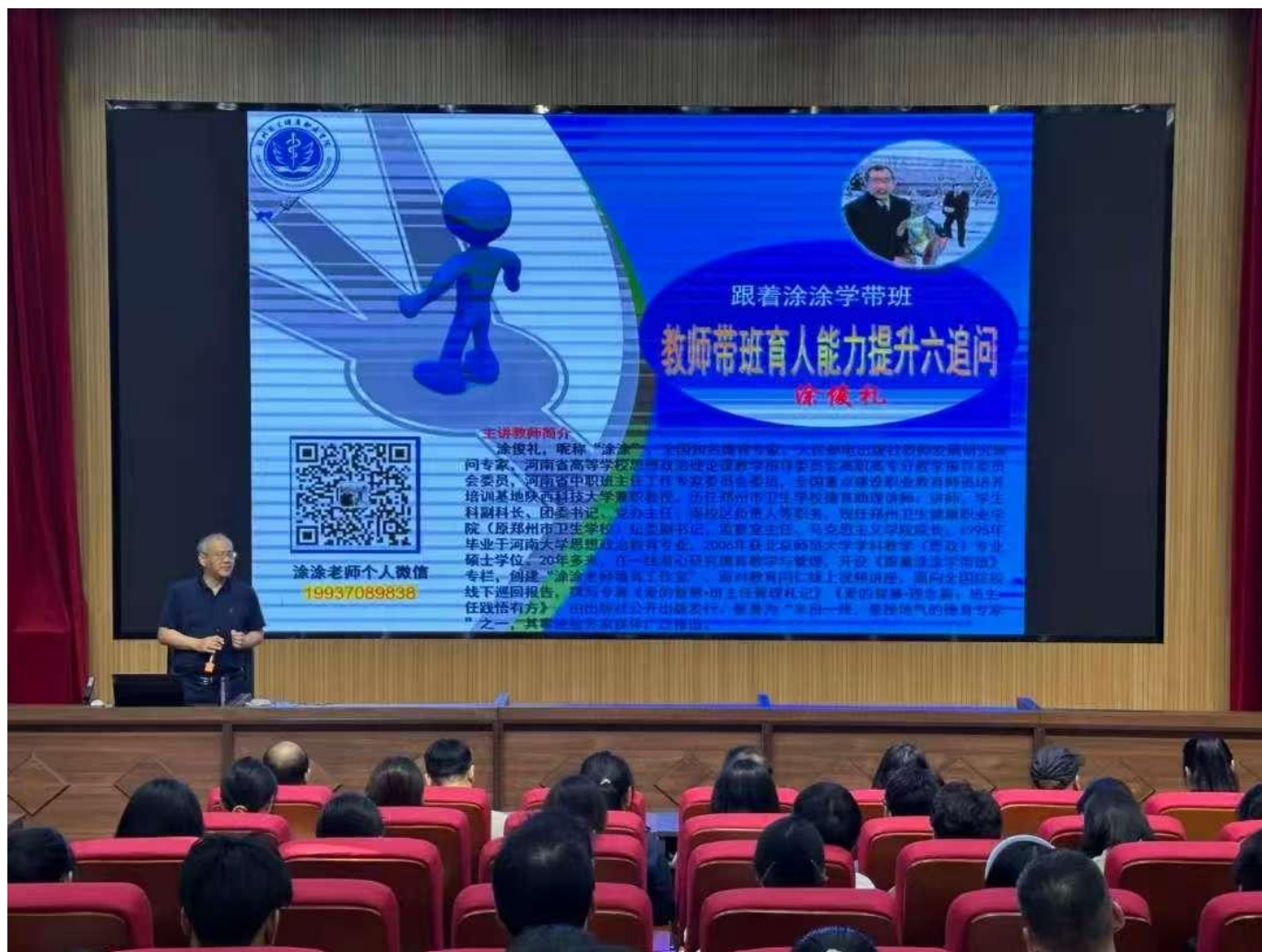
图 8：我校特邀全国知名德育专家涂俊礼做关于《润物无声，匠心育人》的讲座，提升教师素养