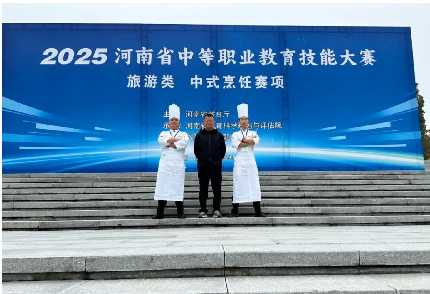
图 13：2025 年河南省中职技能竞赛一等奖