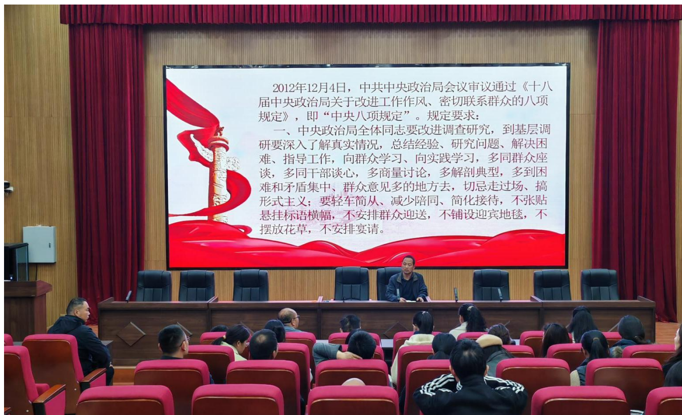
图 18：2025 年 3 月 31 日，我校全体领导干部和党员教师集中学习八项规定