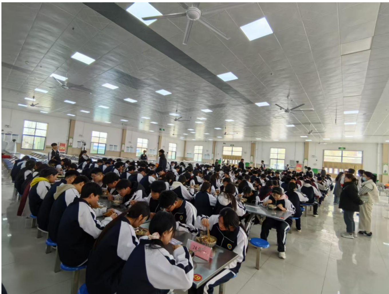
图 30：我校学生开展无声就餐及光盘行动