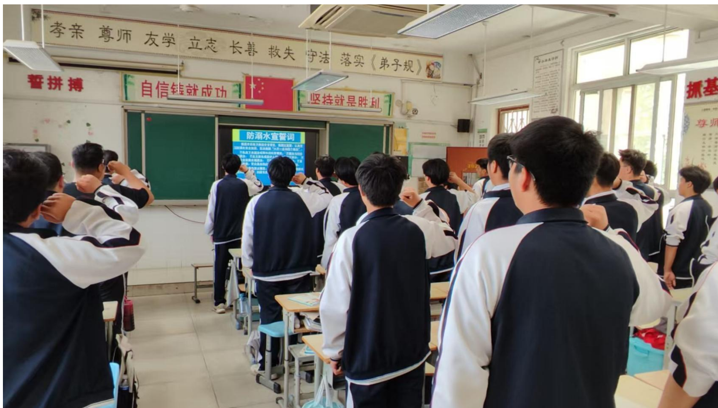
图 2：防溺水宣誓活动