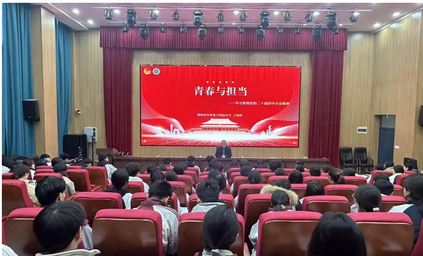
图 23：2025 年 12 月 3 日，我校党总支部书记讲授“青春与担当”团前教育第一课