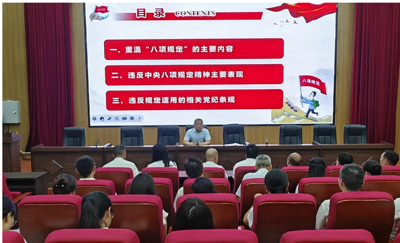
图 21：2025 年 6 月 13 日，我校开展“八项规定专题党课”活动