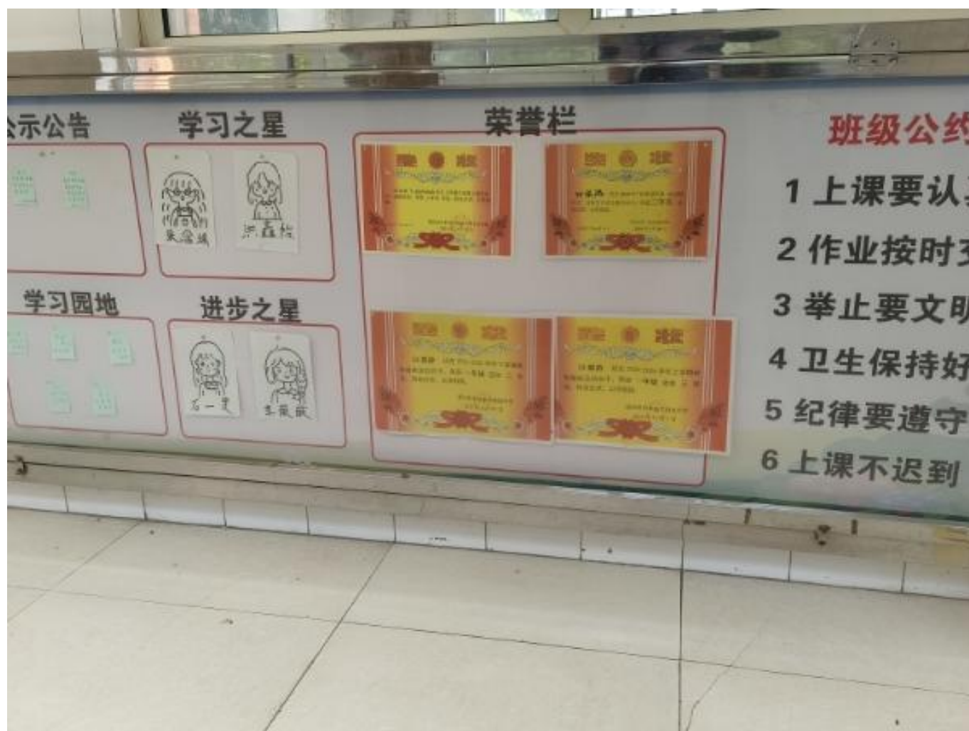
图 27：我校开展班级文化建设活动