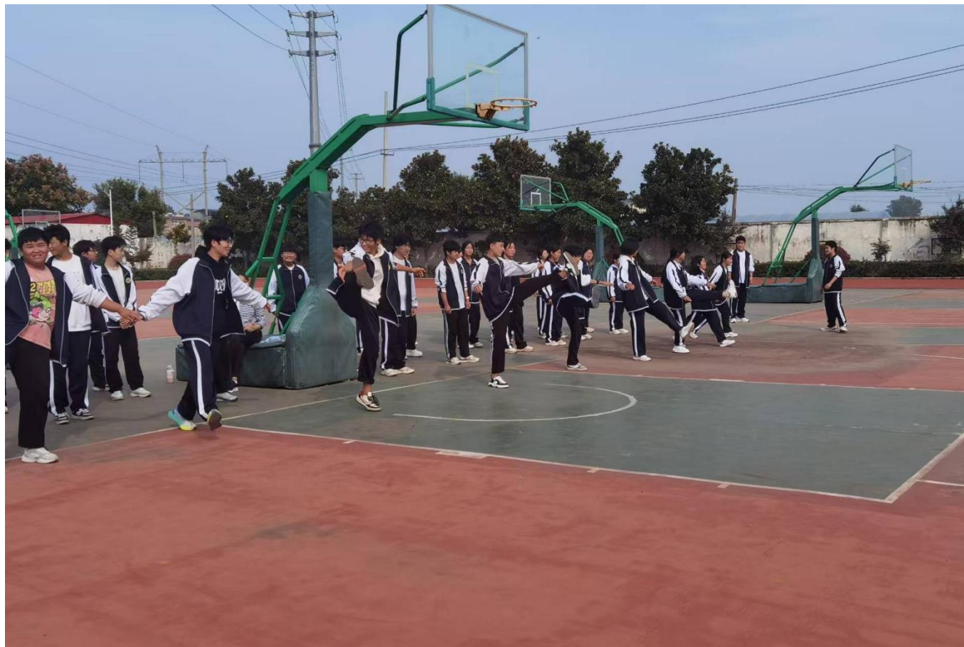
图 11：丰富多彩的社团活动