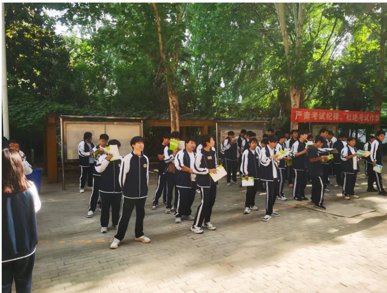
图 26：我校组织经典诵读活动