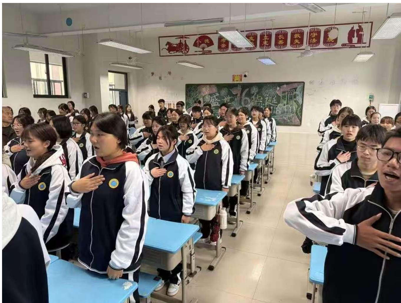
图 35：我校开展弘扬传统文化活动