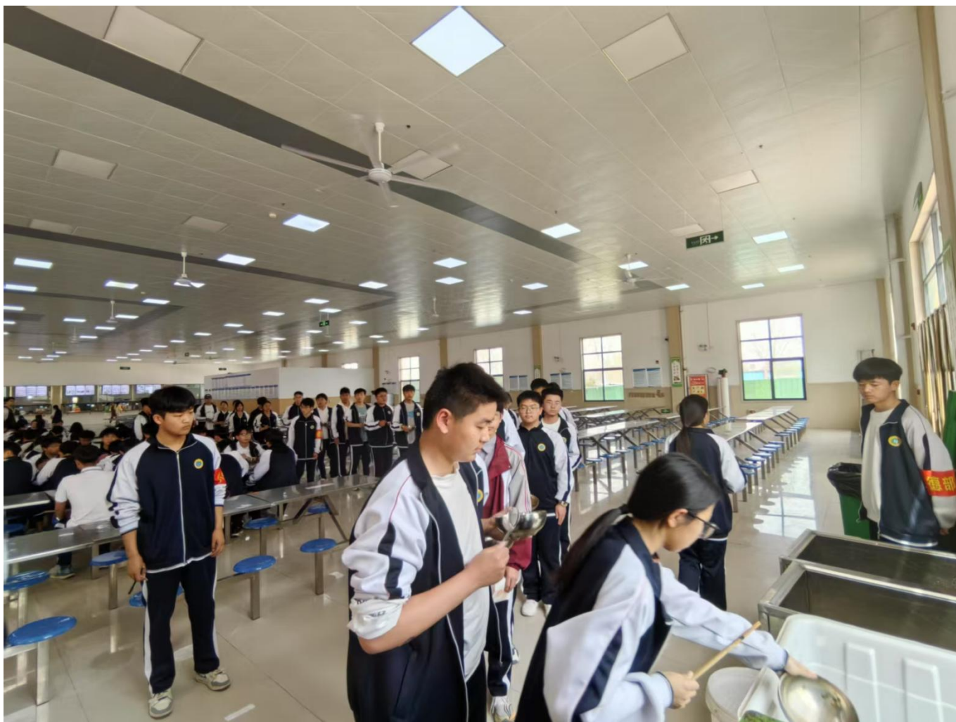
图 29：我校组织无声就餐活动