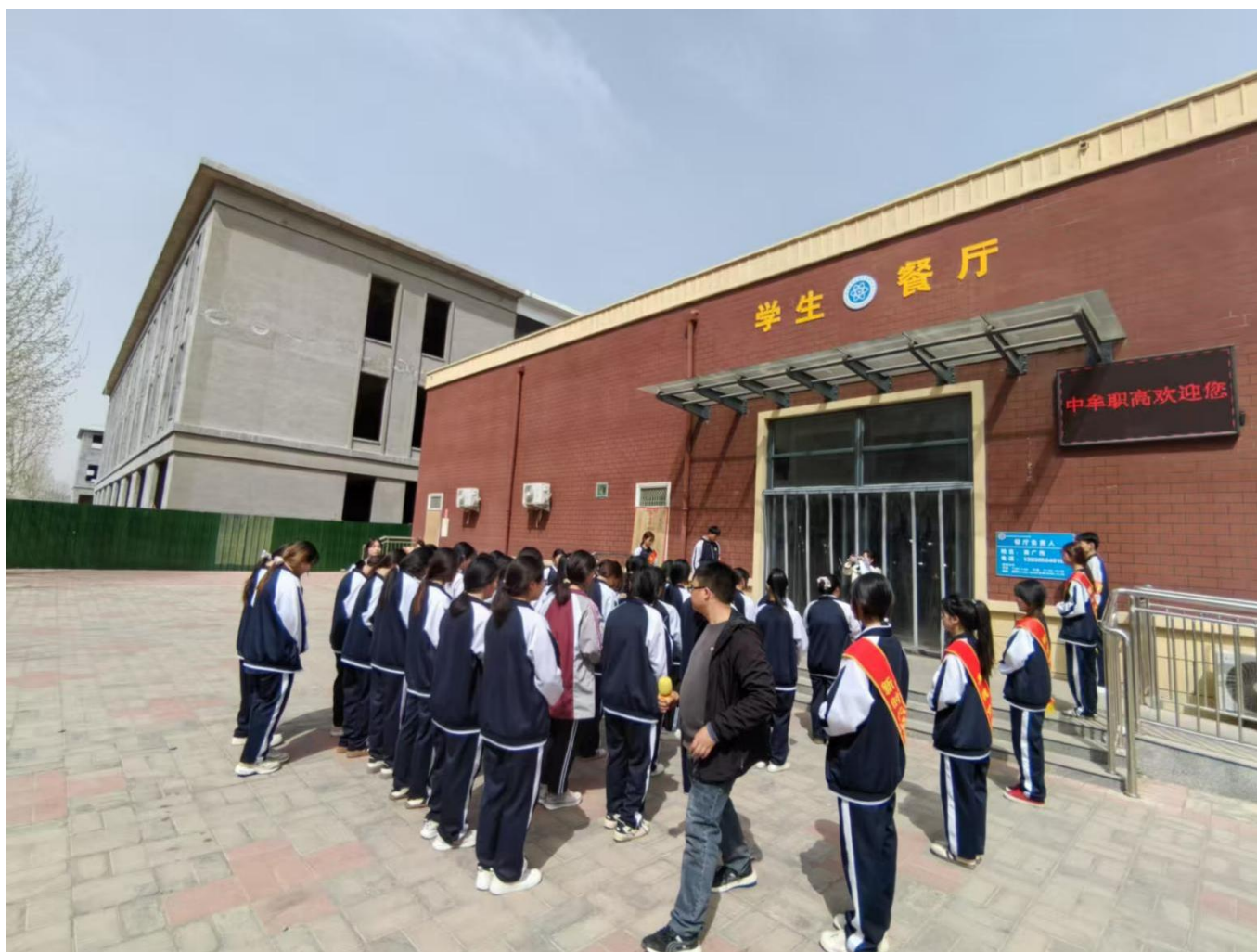
图 31：学生学习就餐礼仪