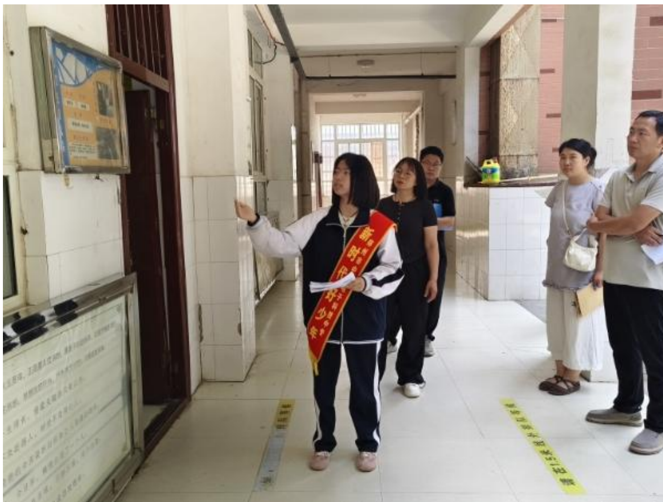
图 28：我校组织丰富的班级文化活动