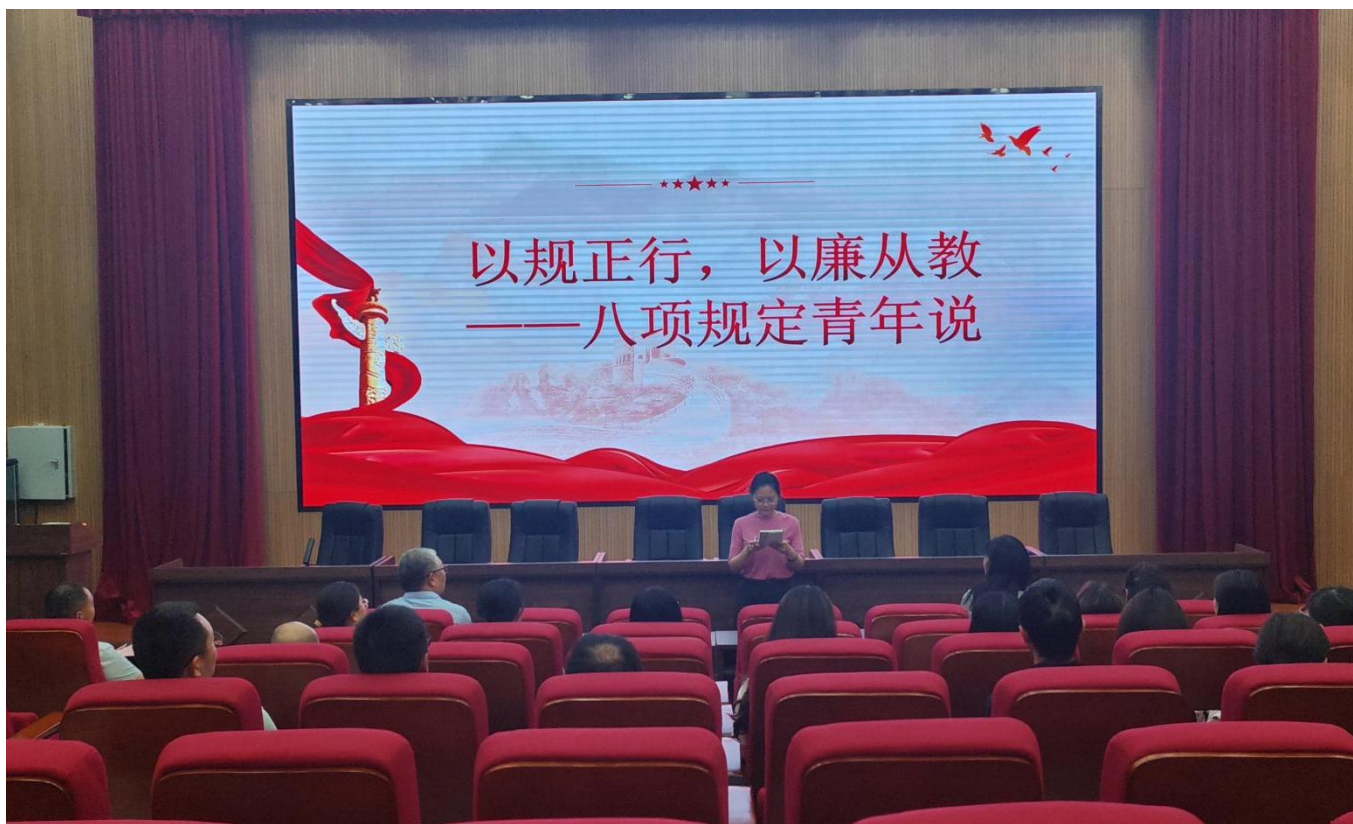
图 20：2025 年 5 月 26 日，我校开展“以规正行 以廉从教”八项规定青年说活动