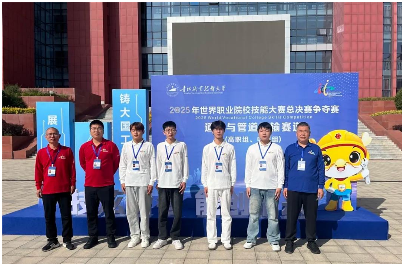
图 12：我校汽车专业参加 2025 年世界技能竞赛